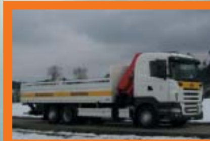
Sto AG, Niederglatt SCANIA R420LB6x2*4HNA Euro4