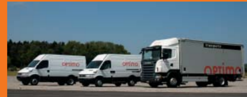
Optimo Service AG, Winterthur IVECO 35C17V/P und IVECO 35S17V SCANIA R420LB4x2MNA Euro4