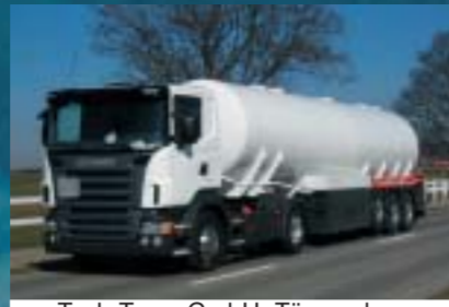
Tank-Trans GmbH, Tägerschen SCANIA R420LA4x2MNA Euro4