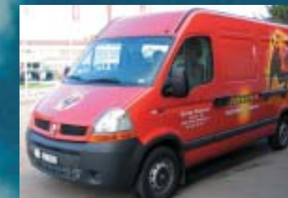
Banner Batterien Schweiz AG, Felben Renault Master 120.35