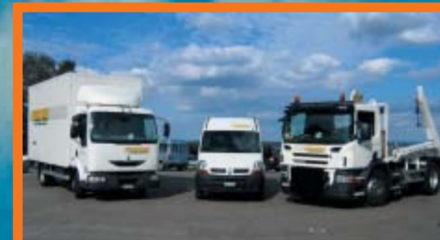
Zecchine Transport AG SCANIA P310DB4x2MNA RENAULT Midlum 220.09/B RENAULT Master 100.33DCI