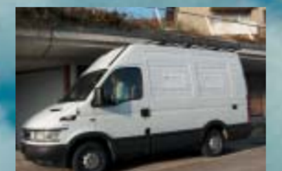
P+P Pepa Bau GmbH, Effretikon IVECO 29L13V Daily City Truck