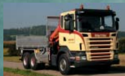
Badertscher Transporte und Logistik AG, Ohringen SCANIA R420CB6x4HNZ Euro4