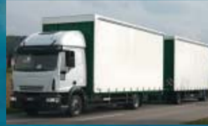
Stamm GmbH, Neunkirch IVECO ML 120E28/P