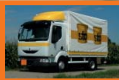
Sto AG, Niederglatt RENAULT Midlum 180.08/B (7,5 to)