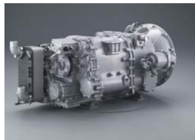
Getriebe GRS 905R, 12 + 2 Gang mit Retarder + Opticruise Schaltung

Die neue Kupplung mit verlängerter Lebensdauer hat jetzt einen besonders verschleissfesten, fünf Millimeter starken Belag, der die Haltbarkeit erheblich verlängert. Die neuen Nebenaggregate bieten noch mehr Wahlmöglichkeiten in Bezug auf Übersetzung sowie Flansch- und Direktmontage.