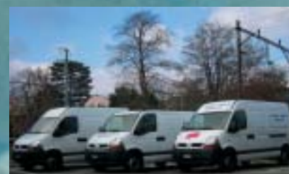
Transport Jucker, Seuzach 3 RENAULT Master 120.35 DCI