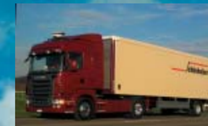
Erwin Wöhrl, Pflyn R380LA4x2MNA Euro4