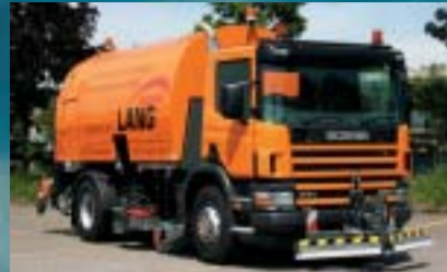
Tiefbauamt Kanton Thurgau, Frauenfeld SCANIA P114GB4x2NB