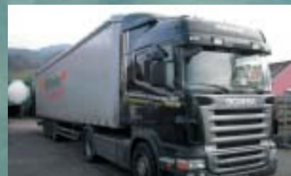
Höhener Transport AG, Ramsen R 420LA4x2MNA Euro4