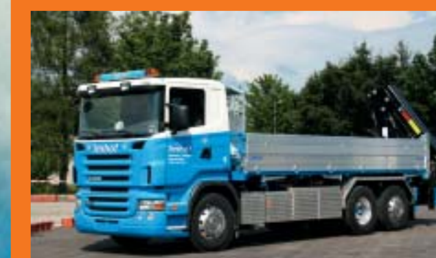
TIT Imhof AG, Stein am Rhein SCANIA R420LB6x2*4HNA Euro4