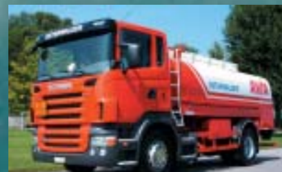
Osterwalder St.Gallen AG, St.Gallen SCANIA R 420LB4x2MNA Euro4