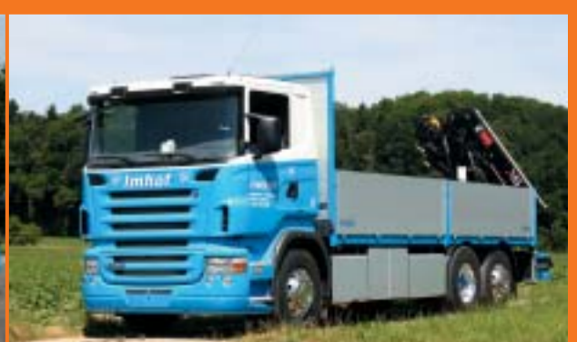
TIT Imhof AG, Stein am Rhein SCANIA R420LB6x2*4HNA Euro4