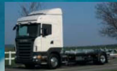
Alba Transporte und Umzüge GmbH, Regensdorf SCANIA R340LB4x2MNB Euro4