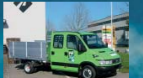
Raymann AG, Frauenfeld IVECO 35C12D Daily City Truck