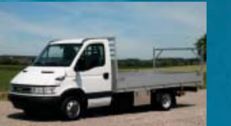
Boretti AG, Erlen IVECO 35C17 Daily City Truck