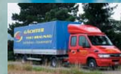
Transporte Gächter GmbH, Braunau IVECO 35C17/35T Daily City Truck