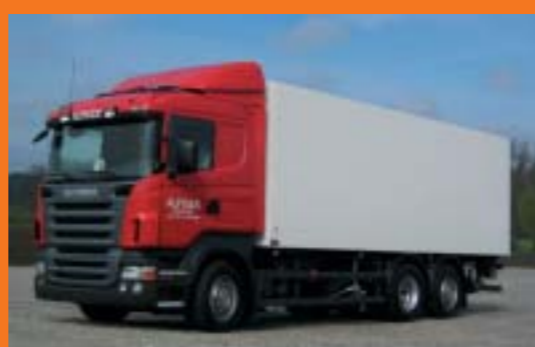
Alpiger Transport GmbH, Alt St. Johann 2 Stück SCANIA R420LB4x2MNB Euro4