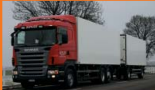
Alpiger Transport GmbH, Alt St. Johann 2 Stück SCANIA R420LB4x2MNB Euro4