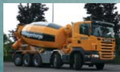
Toggenburger AG, Winterthur SCANIA R420CB10x4*6MNA Euro4