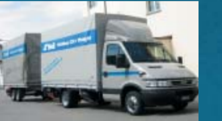
Stoll Transport AG, Pfäffikon ZH IVECO 35C17 Daily City Truck