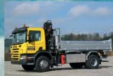
W. Strausak AG, Münchwilen SCANIA P340CB4x2HHZ