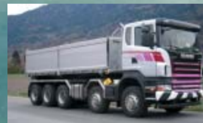
Othmar Hardegger AG, Zizers SCANIA R420CB10x4*6HHZ Euro4