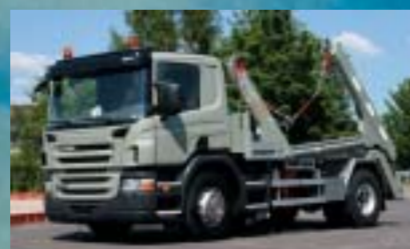
Schiffmann Transport AG, Weiningen P380LB4x2MHZ