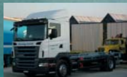
Steiner Express GmbH, Eschenbach R380LB4x2MNB