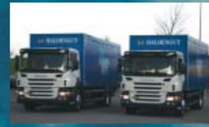
Heineken Switzerland AG, Winterthur 2 Stück SCANIA P340LB4x2MNA