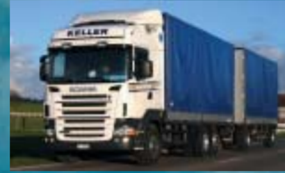
Keller Transport, Matzingen SCANIA R420LB6x2*4MNA, Euro4