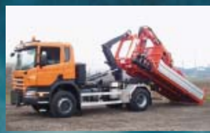
Tiefbauamt Kanton Thurgau, Frauenfeld SCANIA P340CB4x4HHZ