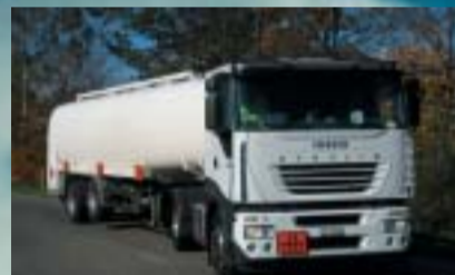
Tank-Trans GmbH, Tägerschen IVECO Stralis AS 440S43T/P Euro5