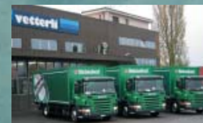
Heineken Switzerland AG, Winterthur 3 Stück SCANIA P340LB4x2MNA