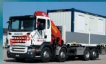
Baltensperger AG, Seuzach Sc R420LB8x2*6HNB Euro4