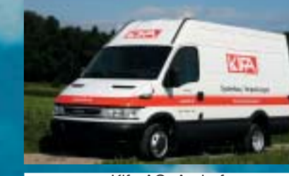
Kifa AG, Aadorf IVECO 35C17V Daily City Truck