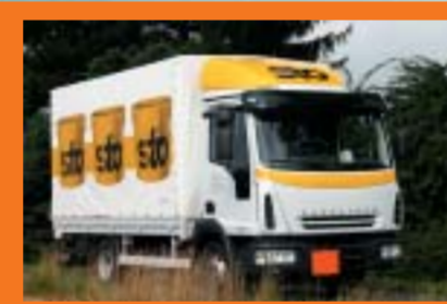
Sto AG, Niederglatt IVECO ML 75E17/P EuroCargo